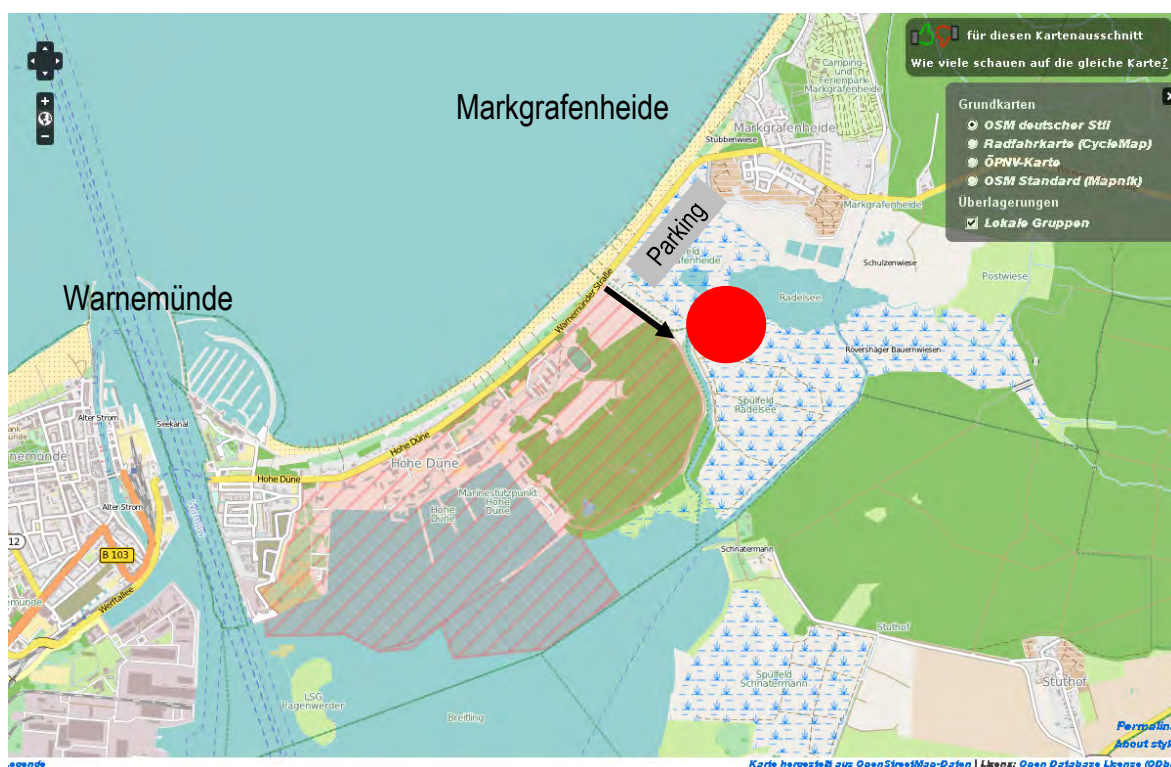
Karte von Warnemünde und Markgrafenheide mit dem Standort des Versuchsdeiches